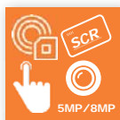
Läsare & Kameror