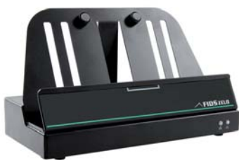
Fordons- och bordsdockor 5) med portar och anslutningar håller FIDS Zelo på plats och säkrar uppkopplingen