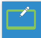
Aktiv Digitizer 1)