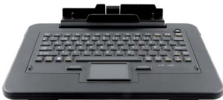
Dockningsbart 2-in-1 tangentbord 5)